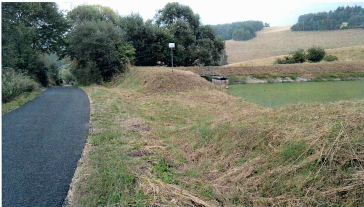
Foto č. 3: Pohled na příjezdovou komunikaci a rybník ve směru Dolního Dražova.