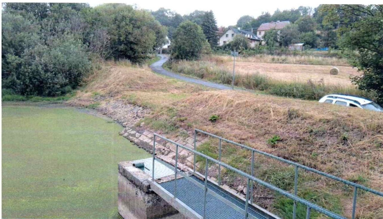
Foto č. 1: Pohled na příjezdovou komunikaci z hráze rybníka ve směru Horního Dražova.